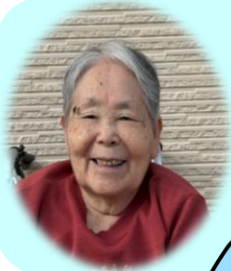
N. Sさん 昭和20年5月10日 81歳