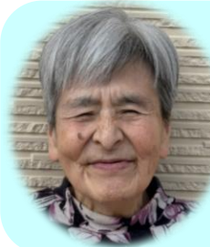
N. Rさん 昭和22年6月9日 79歳

お誕生日おめでとうございます。 いつも穏やかなあなたの 笑顔に癒されています。 季節の移ろいを感じながら 健やかで楽しい一年を お過ごしください。