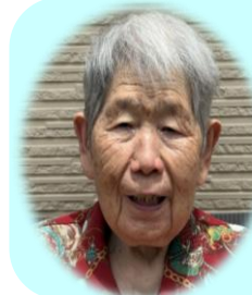
W. Tさん 昭和14年5月31日 87歳