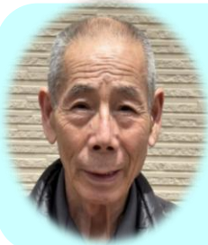
W. Sさん 昭和28年4月1日 73歳