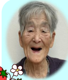
O. Uさん 昭和6年4月8日 95歳