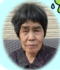
O. Mさん 昭和16年6月2日 85歳